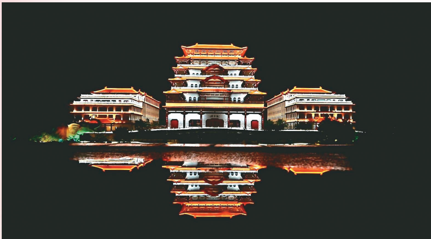
佛光祖庭宜興大覺寺為佛光山開山祖師星雲大師出家的祖庭，2005年大師恢復重建，結合傳統佛教文化與現代弘法方式，傳播人間佛教。圖為融和觀音殿、藏經樓、禪堂、宗史館、講堂等多功能的佛光樓。